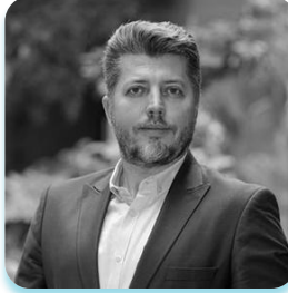
Önder Plana Oyak Renault Türkiye